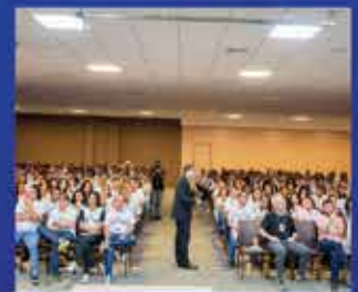
400 Pessoas em Vitória-ES