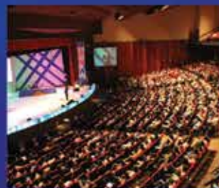
1.500 pessoas em Goiânia-GO