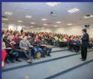
400 Pessoas em Florianópolis-SC