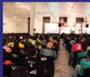
800 Pessoas em Arapiraca-AL