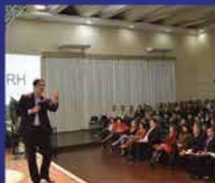
500 Pessoas em Alegrete-RS