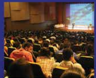
900 Pessoas em Fortaleza-CE