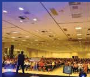
1.200 pessoas em Manaus-AM