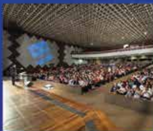
1.700 pessoas em Brasília-DF

Em seu portfólio estão empresas como: Coca-Cola, Avon, Honda Nacional, O Boticário, Quem Disse Berenice, Melitta, Federação das Indústrias do Rio de Janeiro, Caixa Econômica Federal, Correios, Real Distribuidora, Grupo Jorge Costa, Claro, Oi, Vivo, Tim, Unimed, Netshoes, SSA São Salvador Alimentos, e muitas outras.